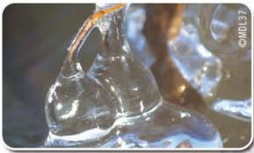
.Sculpture de glace